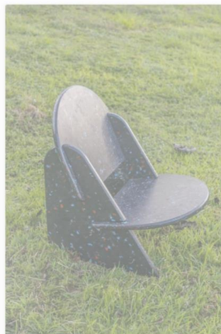
Silla de piso hecha 100% de plástico reciclado! $90.00