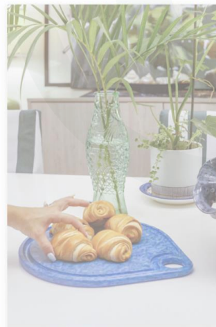
Tabla de mesa hecha 100% de plástico reciclado! $35.00