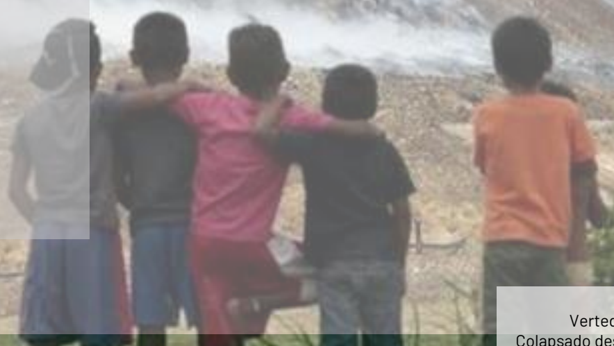
Cerro Patacón Vertedero principal de Panamá. Colapsado desde el 2021 y sigue en uso