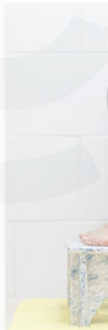
Banquito de Ca... Squatty Potty $40.00