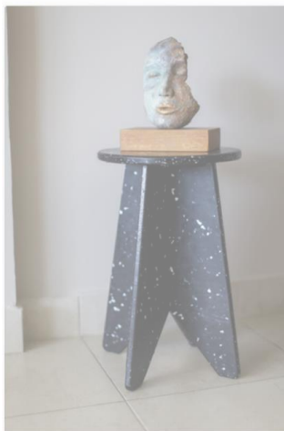
Taburete Taburete de uso múltiple! $65.00

¡Bienvenidos a nuestra tienda virtual! Selecciona cualquier artículo disponible y haz tu pago directamente por aquí!